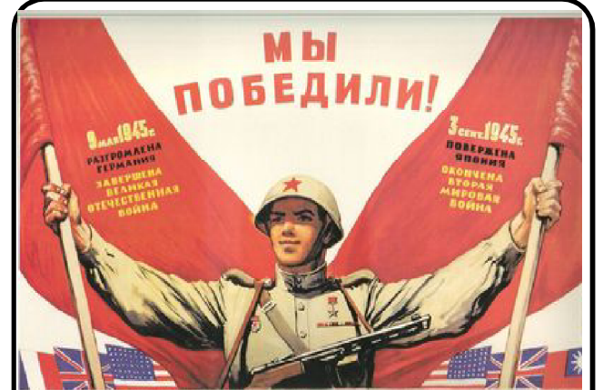
СЛАВА НАШЕМУ ВЕЛИКОМУ НАРОДУ. НАРОДУ-ПОБЕДИТЕЛЮ!