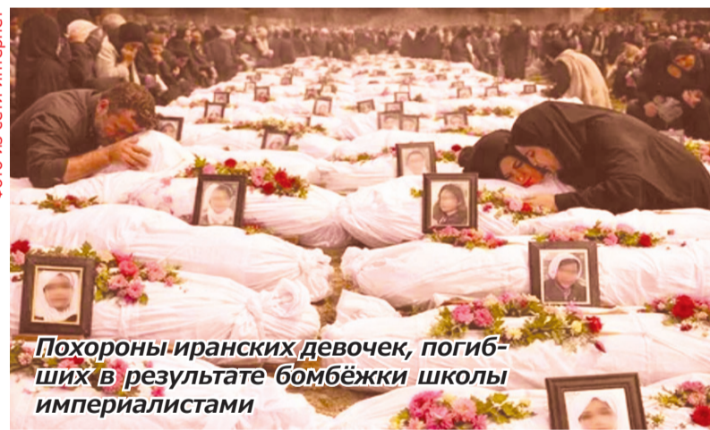
Похороны иранских девочек, погибших в результате бомбёжки школы империалистами

Во времена существования СССР и социалистического лагеря империализм не мог себе позволить такой наглости и цинизма.