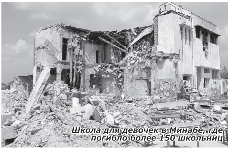
Школа для девочек в Минабе, где погибло более 150 школьниц

В сетях можно встретить высказывания насчёт нападения Америки с Израилем на Иран в том духе, что это не наша война. Это вы серьёзно?