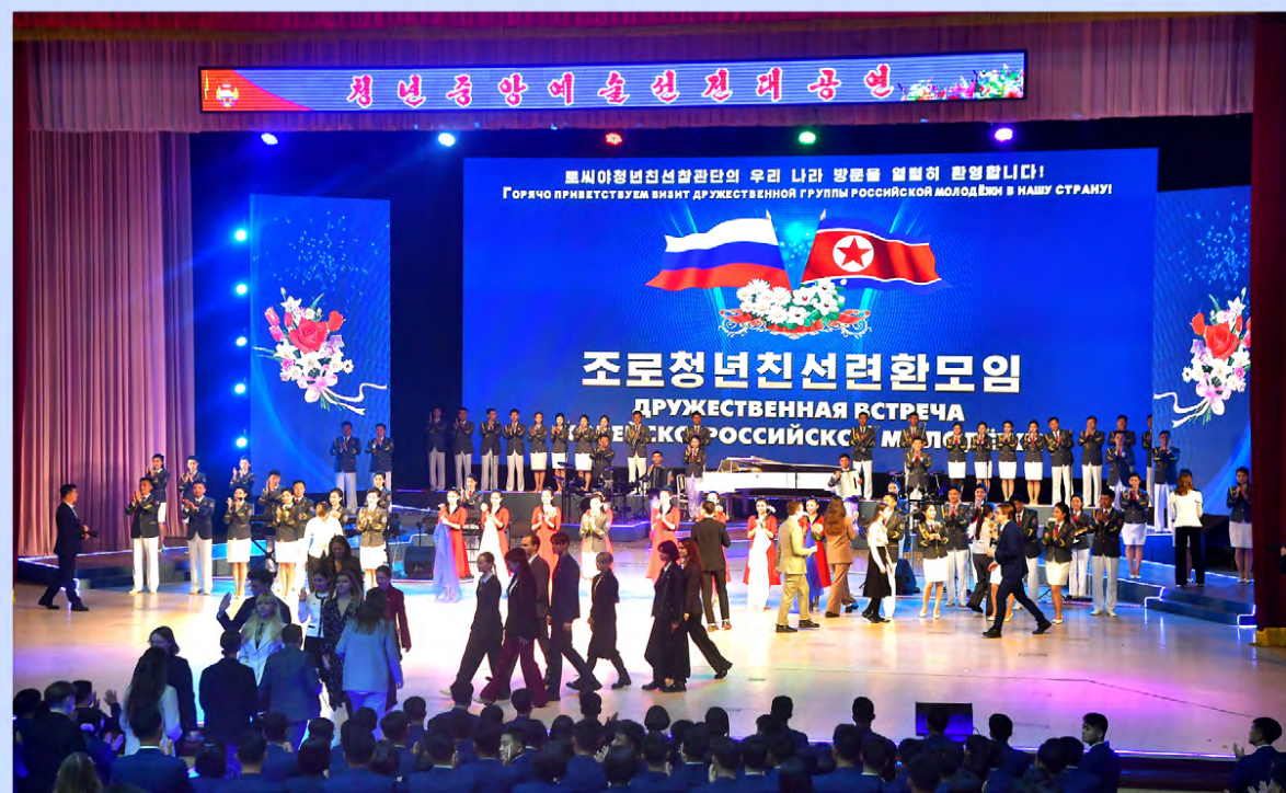
Дружественная встреча молодежи КНДР и России.