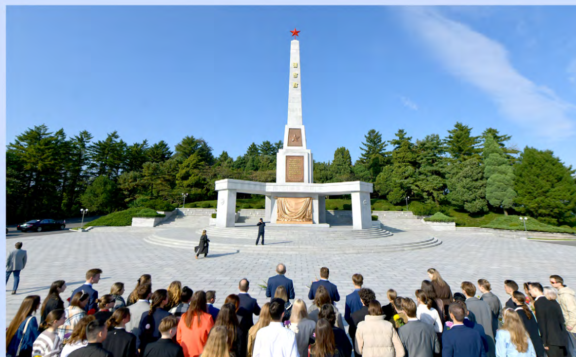
Российские гости возложили цветы к Монументу освобождения.

С 17 по 24 октября нашу страну посетила дружественная группа российской молодежи во главе с председателем Национального совета молодежных и детских объединений России.