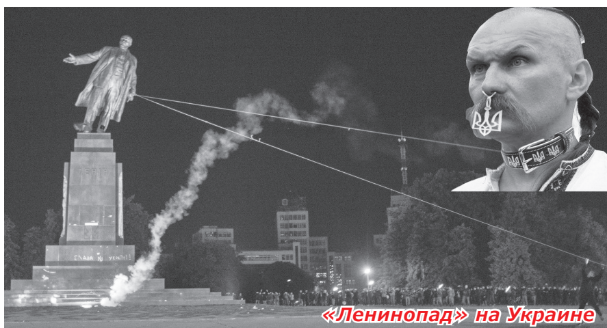
«Ленинопад» на Украине

Вопрос к доблестным работникам ФСБ: может следует заняться поиском реальных фашиствующих бандитов, а не пытаться представить террористами учеников марксистского кружка?