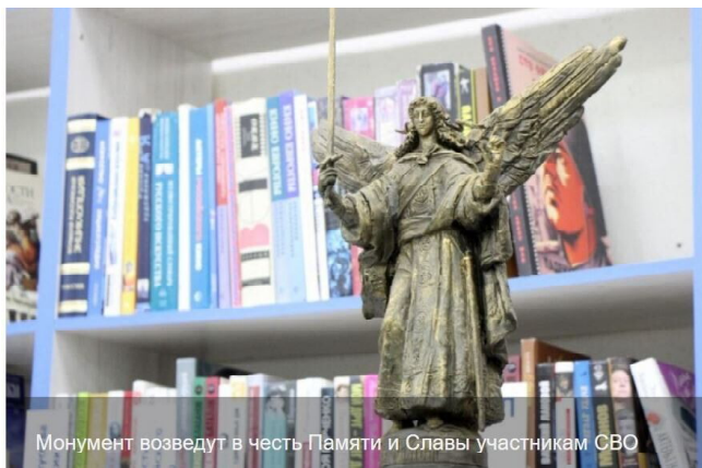
Монумент возведут в честь Памяти и Славы участникам СВО

но как-то видел выступление Владимира Путина, который закончил речь этим лозунгом. Мне показалось, что он несколько смутился, произнося легендарную фразу Суворова "Мы — русские! С нами Бог!". Путин прекрасно понимал, что клич Су-