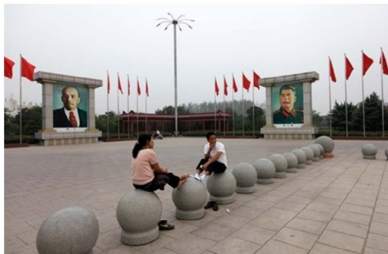
Портреты Ленина и Сталина в Пекине

Что получил Ленин в 1917 году? На фоне бездарного Николая II, который 10 лет готовился к войне с японцами и проиграл быстрее, чем за год, Ленин получил огрызок империи, полное отсутствие армии, разваленную