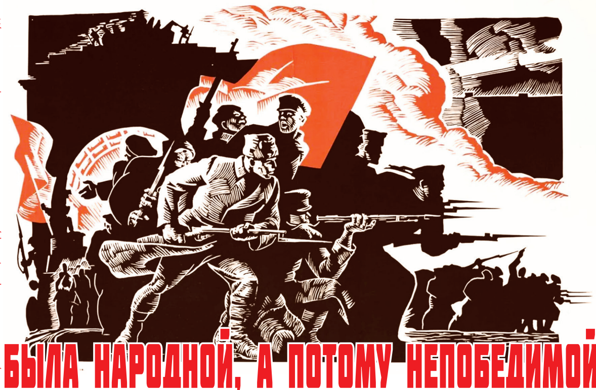
Рисунок из сети интернет, из группы ВК - RED LEATHERMAN | Old-school художник

23 февраля – День Советской Армии и Военно-Морского флота