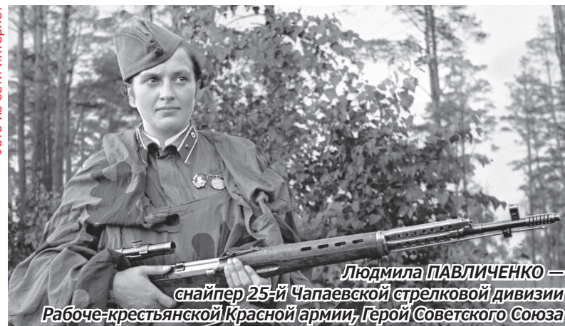
Людмила ПАВЛИЧЕНКО – снайпер 25-й Чапаевской стрелковой дивизии Рабоче-крестьянской Красной армии, Герой Советского Союза