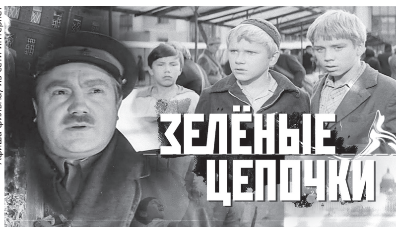
Афиша фильма

военный инженер Алексей Звягинцев. На экране его создал замечательный советский артист Ю. Соломин. Вообще, в киноэпопее представлено созвездие советских актёров: Лебедев, Стрельчик, Громадский, Трофимов. Все они – ленинградцы.