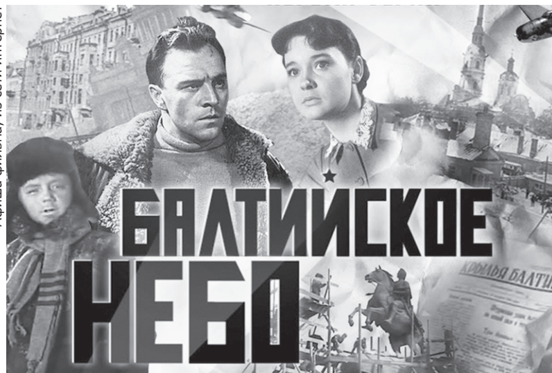
Афиша фильма, из сети интернет

В фильме есть так же образы партийных и советских руководителей И.В. Сталина, К.Е. Ворошилова, Г.К. Жукова. Из ленинградского руководства – А.А. Жданова, А. Кузнецова. Они тоже лишены какой-либо тенденциозности. Зритель воспринимает их как живых, настоящих, с особенно-стями характеров. Ключевым образом является парторг Кировского завода, возглавивший народное ополчение,