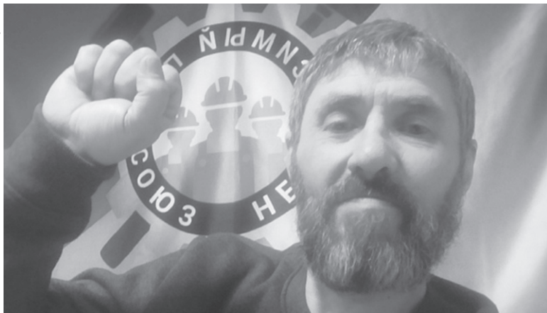
Фото из сети интернет