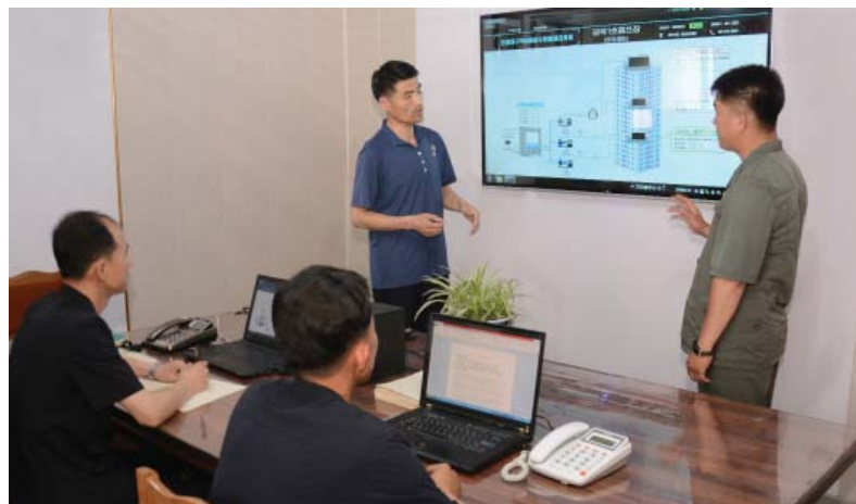
На совещании обсуждают вопрос о создании интегрированной системы управления питьевой водой.

Среди них находятся и работники Мангендэского районного народного комитета города Пхеньяна.