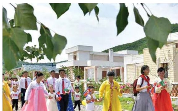
Новоселье в селе Чанхан уезда Санвон провинции Северный Хванхэ.