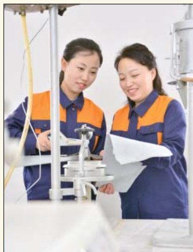
Проверка точности выпускаемой продукции.

Пхеньянская фабрика по дублению кожи реконструирована и модернизирована. Все производственные процессы – от загрузки сырья до завершения продукции, благоустроены на