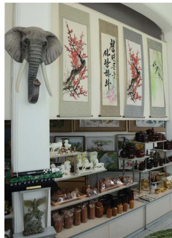
Экспонированы разные сувениры, полные национального колорита.

Русские туристы покупают сувениры на память посещения Пхеньяна.