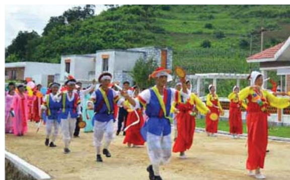
И в селах Ёнхо и Сольбон уезда Косан провинции Канвон построены новые благоустроенные жилые дома, гордящиеся сельской цивилизацией.