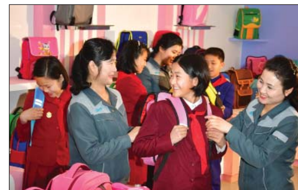
Все учащиеся страны снабжаются формами, ранцами, обувью и учебными принадлежностями за счет государства.