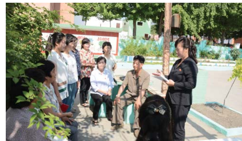
Уясняют встающие в семьях жителей вопросы.