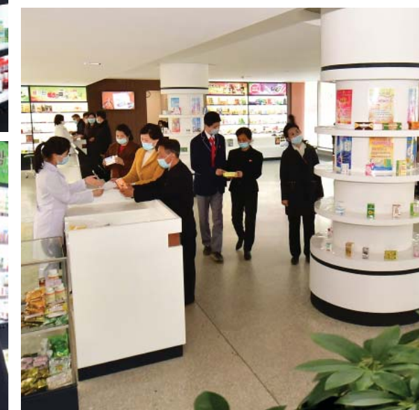
В холле обслуживания.