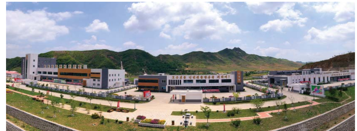
Предприятия местной промышленности в уезде Кимхва.