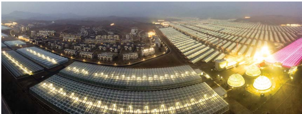
Кандонский тепличный комплекс.