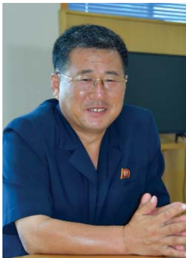
Ли Чи Нам.

Председатель Пхёнчхонского районного народного комитета города Пхеньяна Ли Чи Нам является депутатом Верховного Народного Собрания. Все жители района с уважением называют