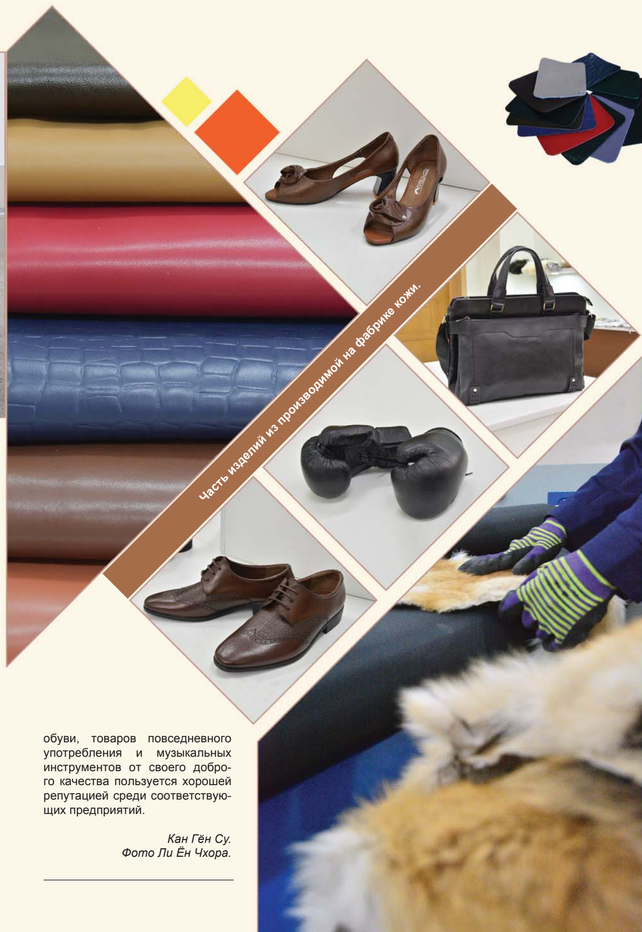
Часть изделий из производимой на фабрике кожи.

обуви, товаров повседневного употребления и музыкальных инструментов от своего доброго качества пользуется хорошей репутацией среди соответствующих предприятий.