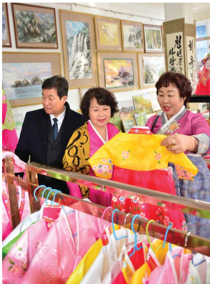
Зарубежные корейцы из Китая посетили выставку.

Продавщицы приветливо обслуживают посетителей, свобод-