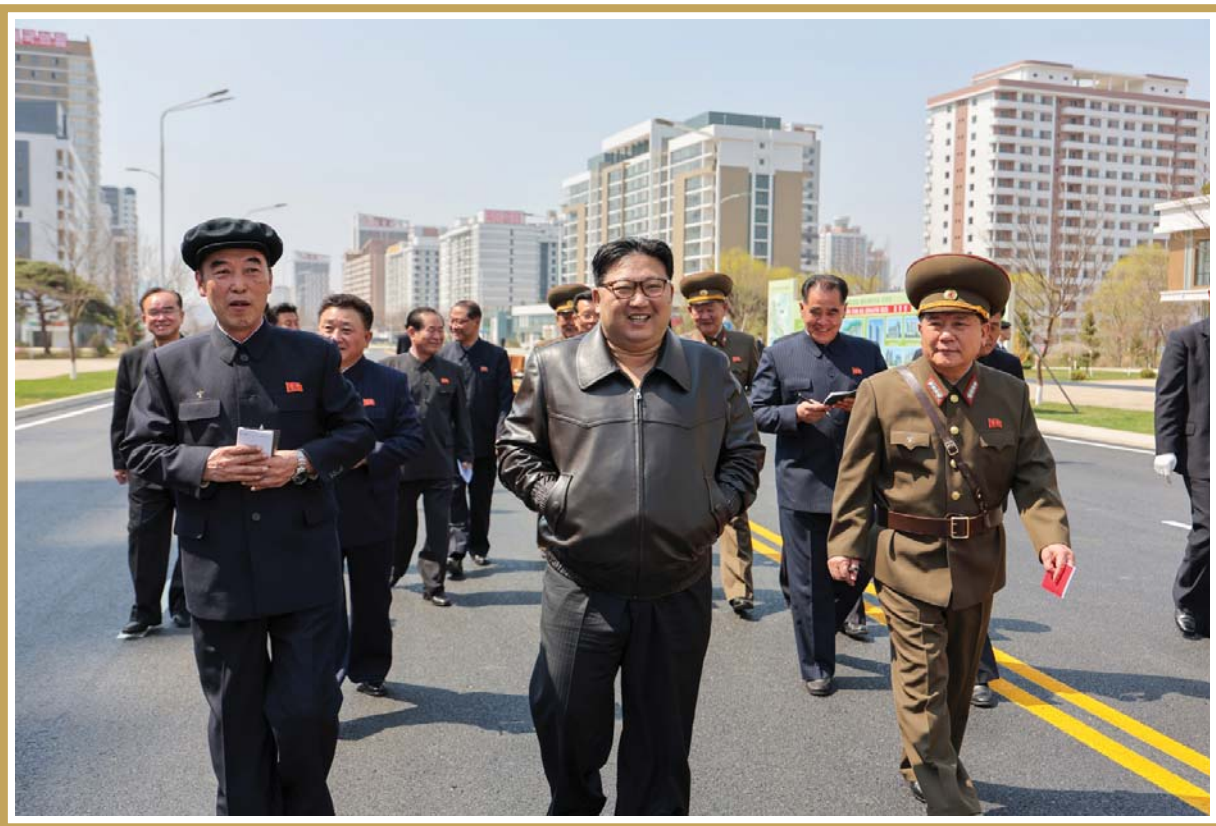
Уважаемый Ким Чен Ын руководил на месте работой стройки жилых домов на 10 тысяч квартир – второго этапа жилстроительства в районе Хвасона перед его завершением (апрель 2024 г.).