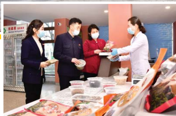
В киоске корёских лекарственных трав.

Сейчас в городах и уездах страны форсируется строительство стандартных аптек. Подтверждение этому – объединенная аптека при Моранбонском районном учреждении по обеспечению медикаментами.