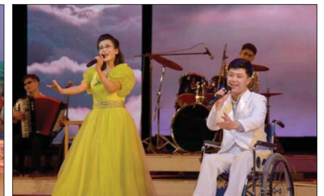
Инвалиды вволю развивают свои талант и надежду.