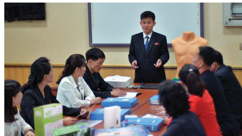
Соединяют знания в разработке новых изделий.