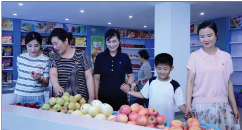
В объединенном магазине в квартале Чонви-2.

Мы встретились с руководящим работником Пхеньянской ТЭЦ, который приехал поздравить своих рабочих с новосельем.