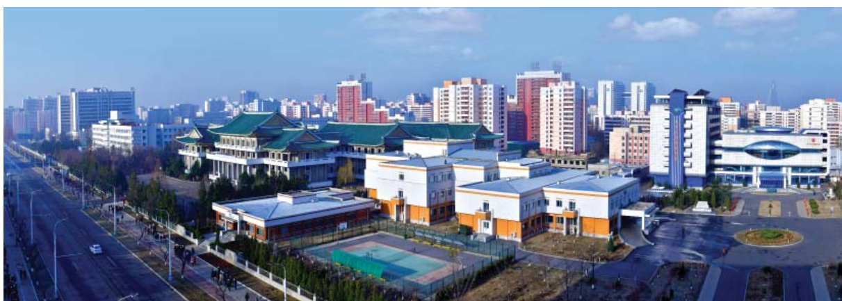
В микрорайоне Мунсу города Пхеньяна имеется городок специализированных и объединенных больниц. Они отражают народные мероприятия ТПК и государства в области здравоохранения, не жалеющих ничего в деле укрепления здоровья населения.

политику по развитию местной промышленности, нацеленную на совершение коренного перелома в ликвидации вековой отсталости периферии и реализации желания ее жителей, и важные меры