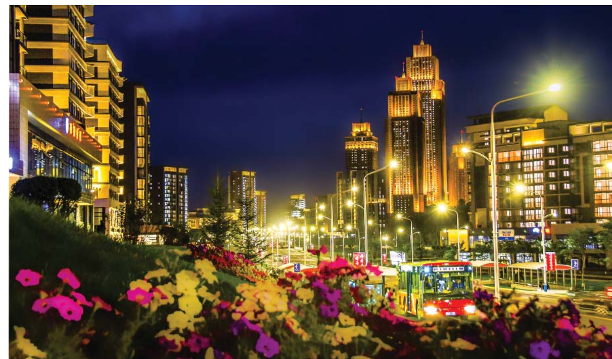
Улица Чонви, строительство которой началось в феврале 2023 года и закончилось в мае 2024 года.

созданию крупных тепличных хозяйств для населения местностей, где не хватает овощей, новых, больших жилых домов для жителей пострадавших от стихийных бедствий местностей,