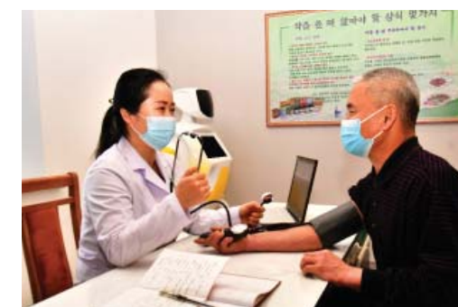
В кабинете собеседования.