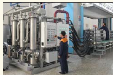
Процесс вакуумной сушки.