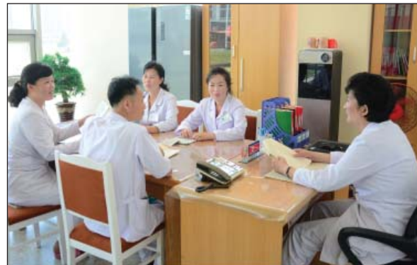
В поликлинике улицы Чонви.