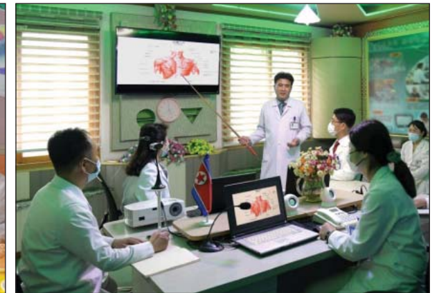
Обращают первостепенное внимание на профилактику заболеваний.