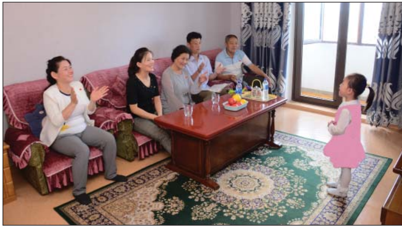
В новой квартире улицы Чонви.