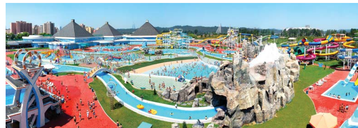
В 2013 году построен Мунсуский аквапарк, имеющий обширную площадь в около 110 тыс. кв. м. Его крытый плавательный бассейн занимает площадь 16,5 тыс. кв. м и принимает в день примерно 1200 человек.