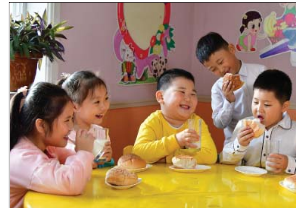
Государство бесплатно и регулярно снабжает всех детей молочными и другими питательными продуктами.