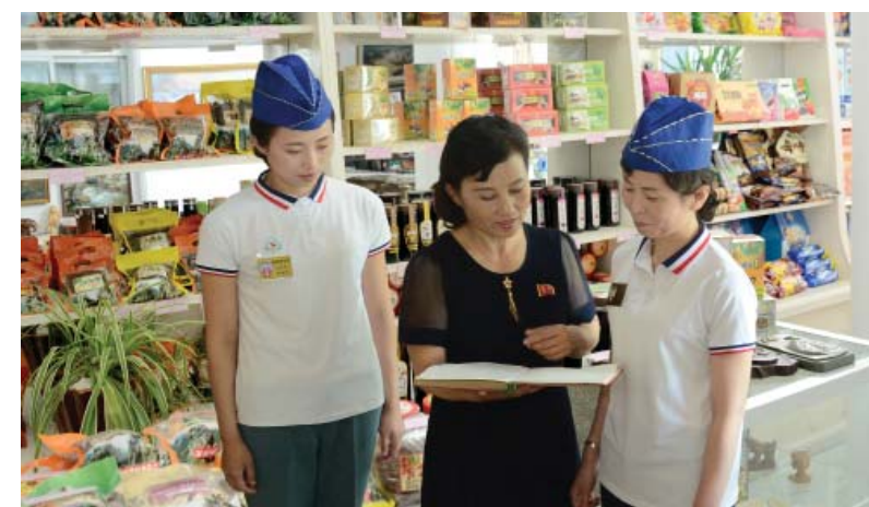
В магазинах обследуют спрос населения.