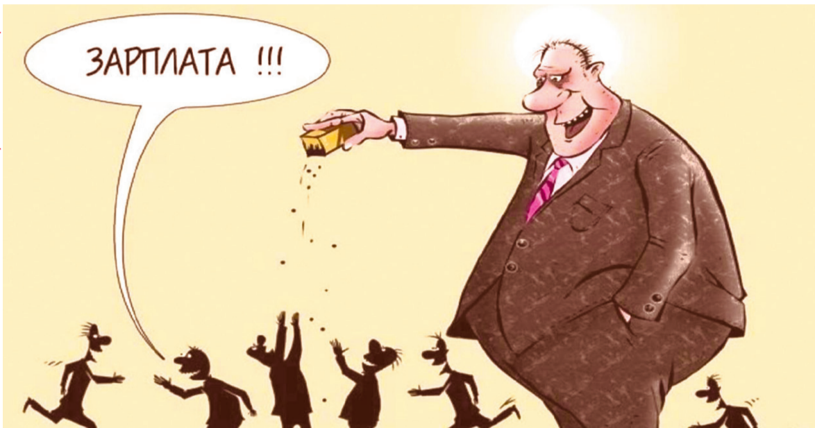
Рисунок из сети интернет