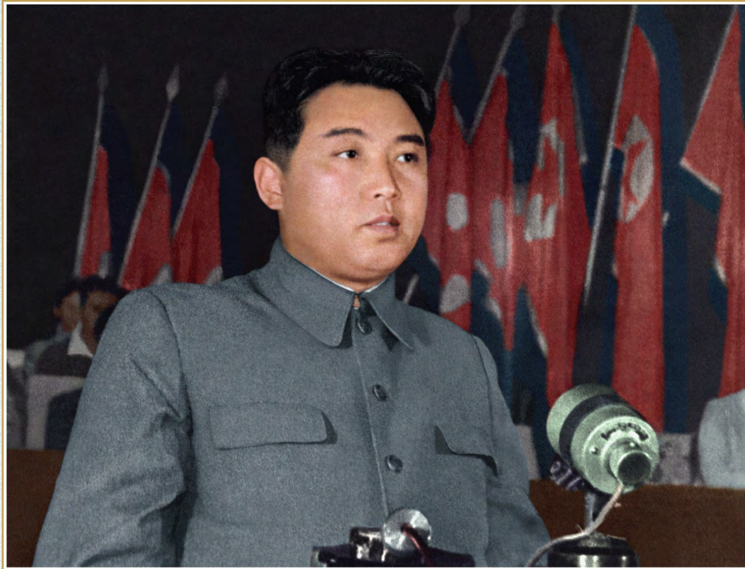
На I сессии ВНС КНДР Ким Ир Сен обнародует Политическую программу правительства Республики. Сентябрь 37 года чучхе (1948).

рейской революции и правильный путь. Только этот путь гарантирует подлинную свободу, счастливую жизнь корейскому народу и может крепко объединить широкие патриотические и демократические силы, тем самым добиться полного суверенитета и независимости страны.