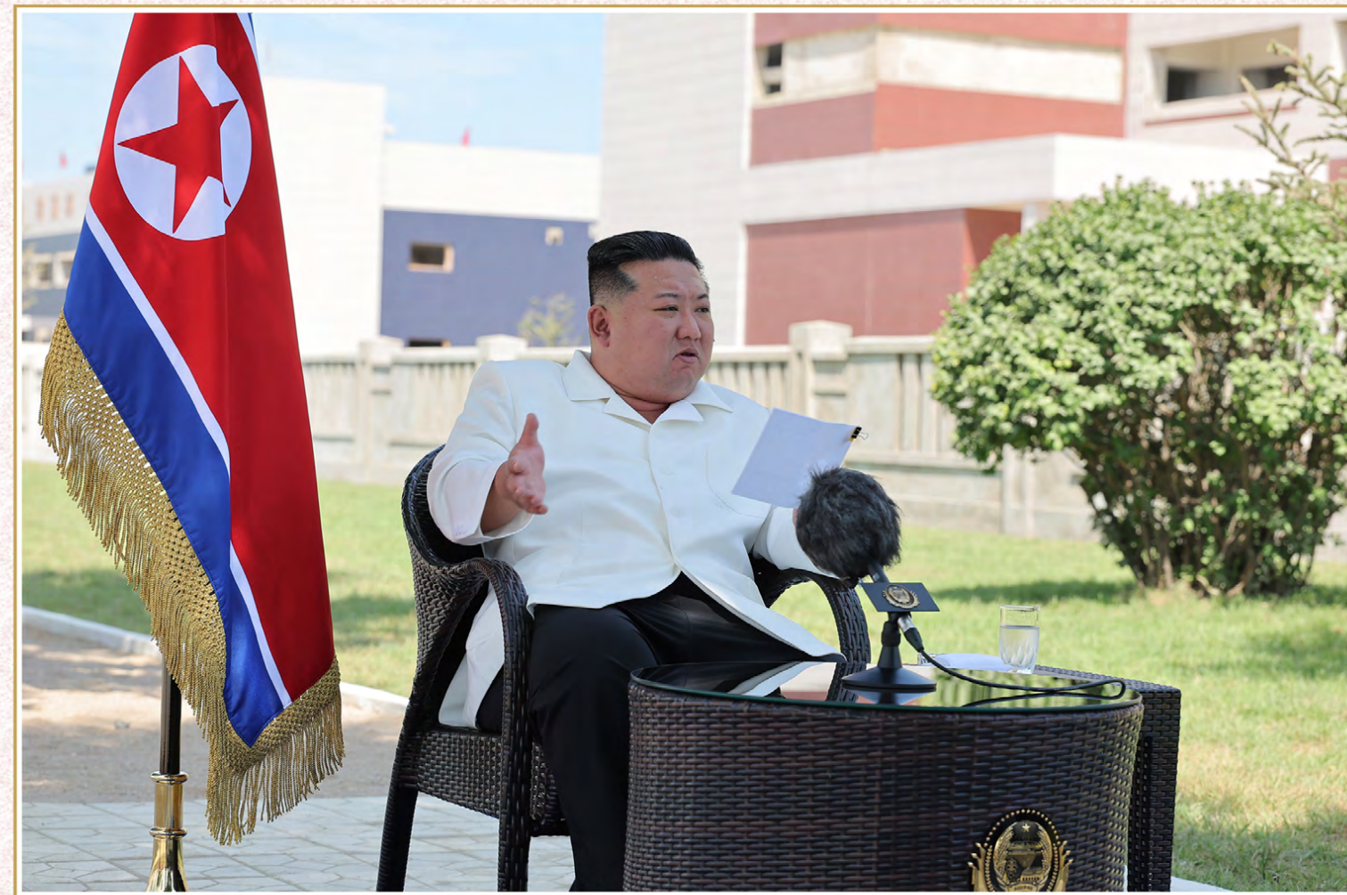
Ким Чен Ын сказал, что наша партия, твердо поверив в верность и боеспособность Народной Армии, поручил ей грандиозный и священный исторический процесс перемен периферии, достигаемых собственными силами. Он обозначил все задачи для яркой демонстрации мощи нашей армии в славной грандиозной борьбе за строительство.

Он, говоря, что каждый воин, совершающий блестящие подвиги в авангарде намеченной партией средне- и долгосрочной борьбы, является самым ценным солдатом революции, подчеркнул: руководящие кадры партии и правительства, командный состав ведомств вооруженных сил должны прилагать всемерные усилия и к созданию более удовлетворительных условий работы и санитарно-культурной жизни для военных строителей.