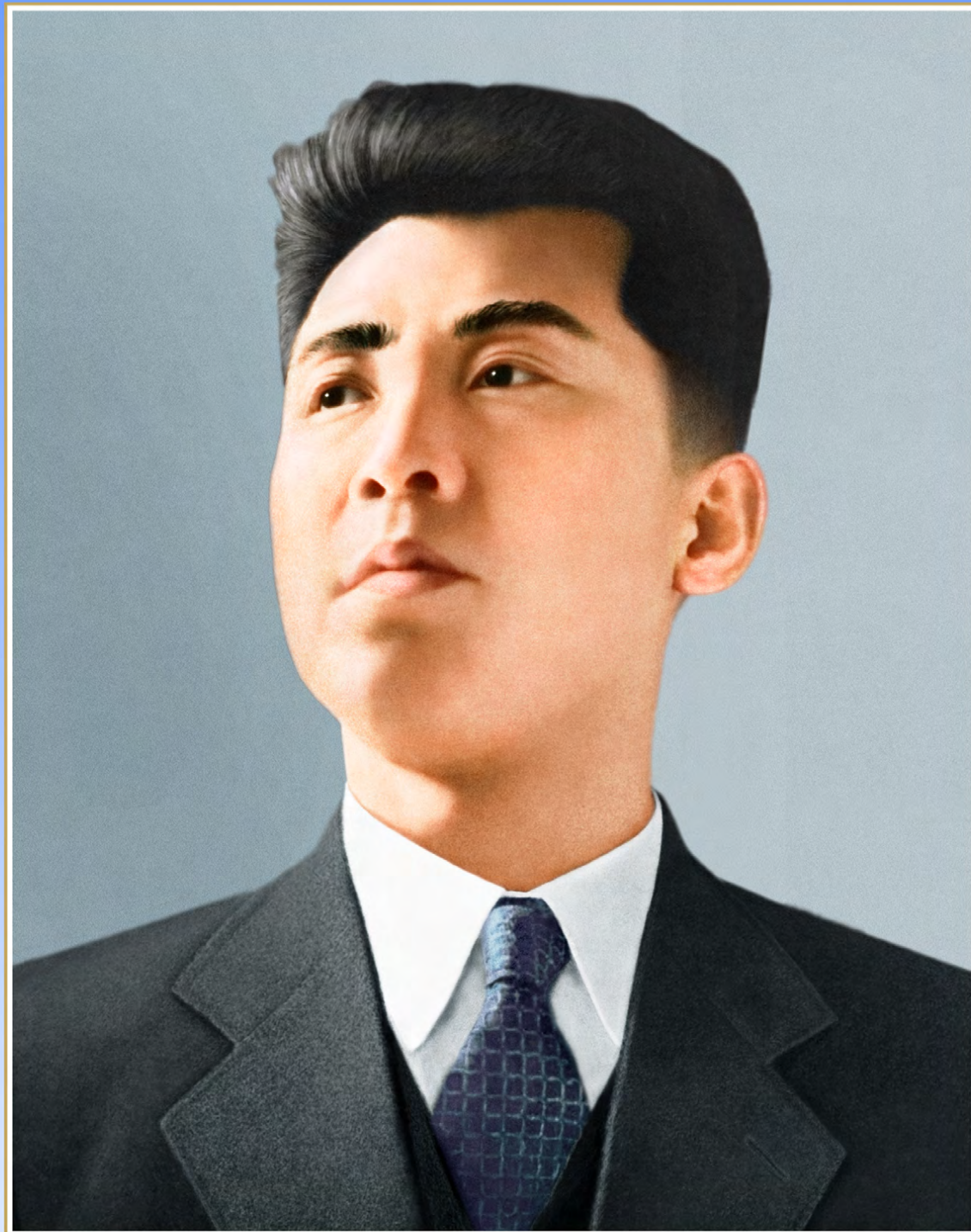
Ким Ир Сен во время строительства обновленной Родины.