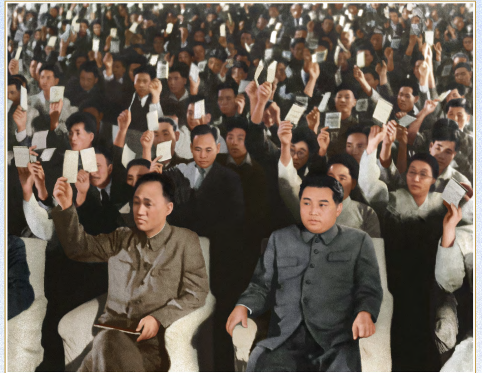
Ким Ир Сен избран Председателем Кабинета Министров на I сессии ВНС КНДР. Сентябрь 37 года чучхе (1948).

власти, в первые годы вооруженной борьбы за освобождение Родины образовал на опорных партизанских базах народно-революционное правительство, представившее собой форму власти нового типа, накопил ценный опыт в построении народной власти.