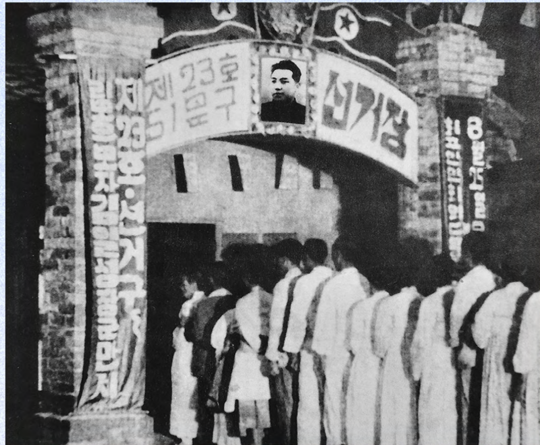
Избирательный пункт для выборов депутатов ВНС КНДР. Август 37 года чучхе (1948).