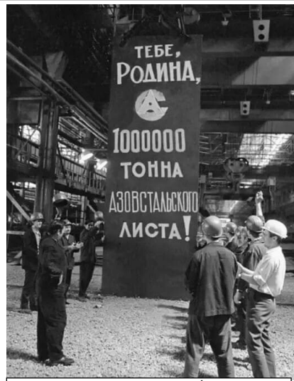
Работники завода во время сдачи миллионной тонны проката, 11.08 1974 года.

Поневоле вспоминались годы гитлеровской оккупации. Осенью 1941 года оборудование с «Азовстали» было демонтировано и вывезено на Урал. Наступило время немецкой оккупации: завод «Азовсталь» был передан в управление концерну «Фридрих Крупп». Немцам удалось частично восстановить производство на предприятии. Перед отступлением немецких войск из Мариуполя, 7 сентября 1943 года, «Азовсталь» был почти