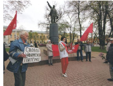
Калуга. Митинг у памятника Ильичу. Секретарь региональной п/о РКРП с плакатом «Свободу Уфимской Пятёрке»