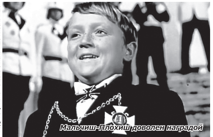
Кадр из фильма «Сказка о Мальчише-Кибальчише»