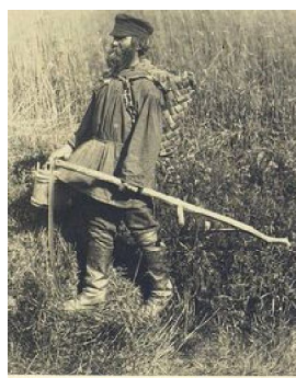
Олонецкий уезд. Корель-корелы.