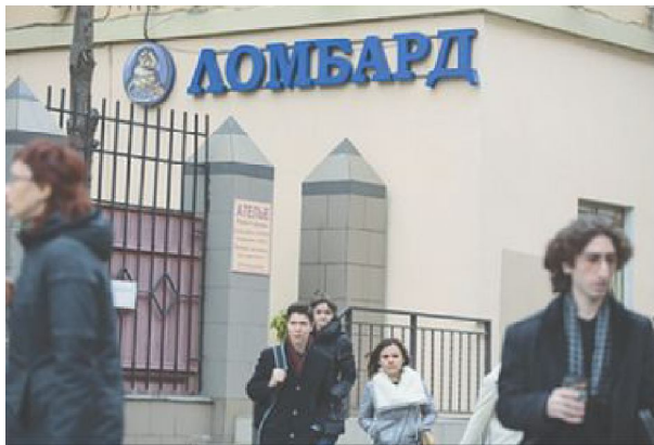
Молодые россияне часто вынуждены обращаться за кабальными ссудами в ломбард и микрофинансовые организации.

Интересную информацию опубликовала недавно «Независимая газета». Речь идет о том, что за последние годы в РФ происходит относительное обнищание студентов и большей части молодежи.