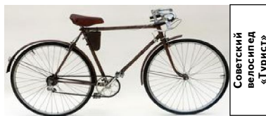
Советский велосипед «Гуритса»

«В будущем сезоне мы продолжим развивать велопрокат по поручению мэра Москвы Сергея Собянина... В планах начать производство полностью российского велосипеда, который может появиться на улицах Москвы уже через два года», — пообещал в конце 2023-го заммэра М. Ликсутов.