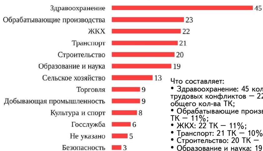
Количество трудовых конфликтов в России по отраслям в 1 квартале 2024 г.

Что составляет: • Здравоохранение: 45 коллективных трудовых конфликтов — 22% от общего кол-ва ТК; • Обрабатывающие производства: 23 ТК — 11%; • ЖКХ: 22 ТК — 11%; • Транспорт: 21 ТК — 10%; • Строительство: 20 ТК — 10%; • Образование и наука: 19 ТК — 9%.