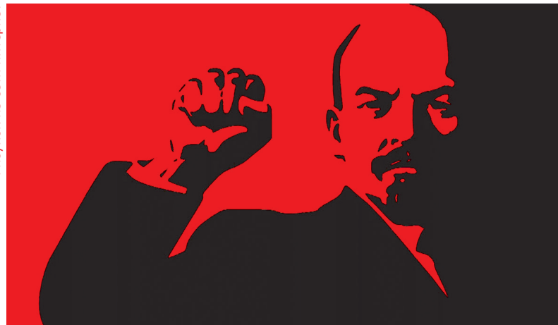
Рисунок из сети Интернет