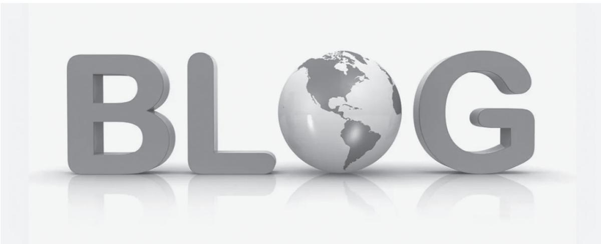
Рисунок из сети интернет

русского населения на их территориях. В результате, получается таблица, из которой понятно, что численность русского народа росла в последние 30 лет Советской власти темпами 1 миллион 34 тысячи человек в год, дав прирост в 31 миллион человек. А вот после распада СССР и отказа от советского строя убыль с 1989 года по 2021-й составила почти 29 миллионов или около 1 миллиона в год. 900 тысяч, если быть точным.