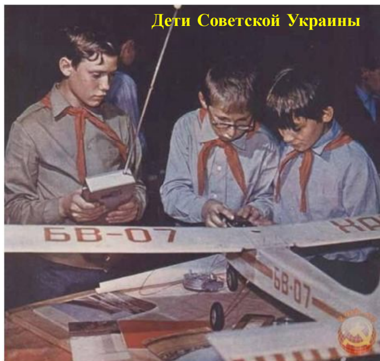
Дети Советской Украины