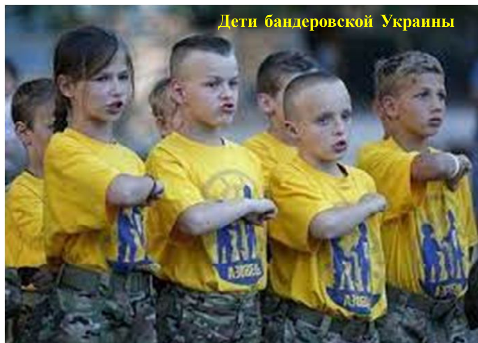
Дети бандеровской Украины