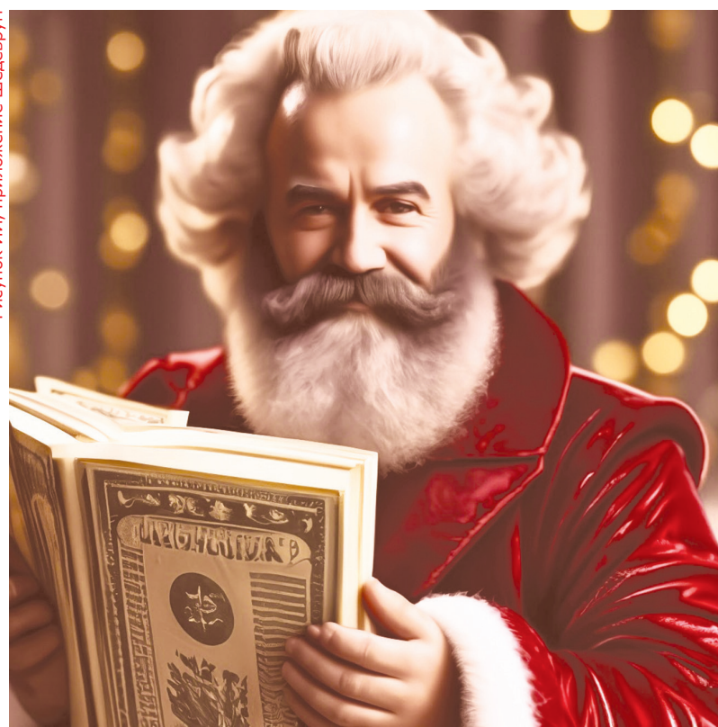
Рисунок ИИ, приложение Шедерум

Официально именуемая спецоперацией война на Украине оставалась главным политическим нервом для нашей страны и всего мира; уходящий год был вторым годом её проведения. Наша партия подтвердила свою позицию по отношению к войне, и эта позиция сегодня обретает всё больше сторонников. Мы повторяем, что для России война с украинскими фашистами и стоящим за ними блоком НАТО носит в значительной степени вынужденный,