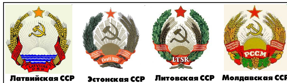
Латвийская ССР Эстонская ССР Литовская ССР Молдавская ССР