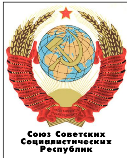
Союз Советских Социалистических Республик

Растите и принимайте участие в этой самой справедливой борьбе. Тогда победа обеспечена!