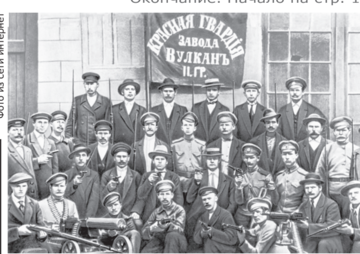
марте-апреле ядро будущей Красной гвардии образовано в 17 городах, в мае-июне - ещё в 24-х. Рабочий характер красногвардейского отряда определялся тем, что его состав утверждался фабзавкомом.

И эти же капитализаторы многие годы обрабатывали мозги россиянам в том духе, что социализм был аномалией, а теперь мы входим в число «нормальных» и в этом качестве должны вписаться в «цивилизованный мир», то есть капиталистический Запад. Многие годы с погипительным продвижением превозносили все американское и европейское, а теперь возмущаются наличием людей, которых не страшит перспектива увидеть натовских солдат у себя под окнами? Нелогично. Эти же люди не разделяют антифашистских (официально) целей СВО на Украине. А чего им разделять, если столько лет кремлёвские, ныне перекрасившиеся в «патриотов», лгали и лгут на победу советского народа над фашизмом: одержана благодаря загравотрядам, вопреки советскому руководству, с «божьей помощью» и прочая ахинея и грязь. Так что не разделяем мы оптимизм журналиста Руденко насчёт того, что спецоперация на Украине обеспечит безопасность нашей страны. В капиталистическом качестве России не дано обеспечить прочную безопасность, поскольку всегда будет преваляровать корыстные интересы буржуазии над интересами национальными и общественными. Наличие, и в малом количестве, тех, кто ждёт всечеловеческих благ от загнивания, тоже на это указывает.