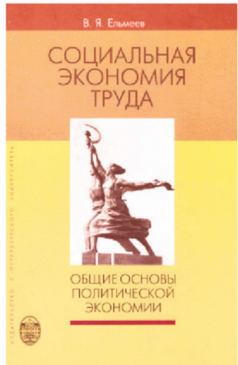
Сен. обложка книги В.Я. Ельмеева

Непосредственно общественной сущности социалистического производства отвечает система экономических методов управления (централизованное планирование, ценообразование, хозяйственный расчет и др.), основанная на экономии затрат. Теория и практика социализма в СССР показала, что «критерием деятельности государственных предприятий при социализме должна быть не прибыль, а противоположная ей величина – экономия труда. Показателем оценки работы предприятий, выпускающих предметы потребления, должна стать сумма снижения цен на выпущенную продукцию, позволяющая потребителю меньше трудиться для получения прежнего набора благ. Предприятия же, производящие средства производства, должны