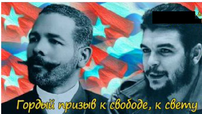
Гордый призыв к свободе, к свету