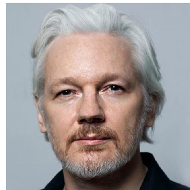
Ассанж — что бы с ним завтра останется гигантом.

Наше величие — в величине врагов, которых мы себе выбираем. В этом отношении Джулиан ни случилось — навсегда останется гигантом.